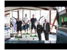
Championnats de France militaire